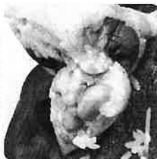
黃豆素粽(可取代花生)